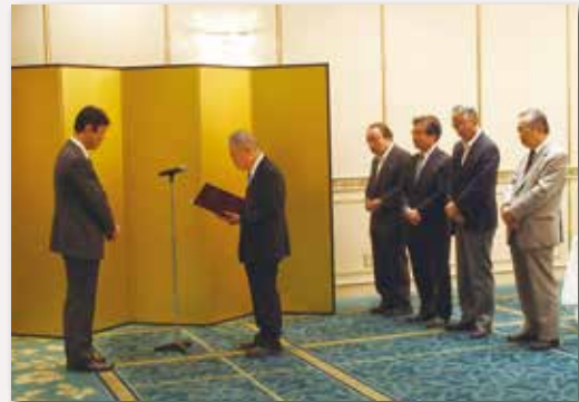
認定書交付の様子